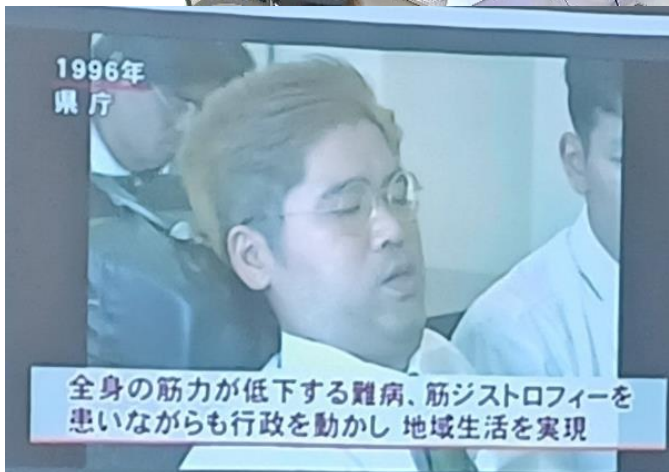
これからも、障害者運動を一生懸命、頑張ろう！